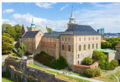
Akerhus, Oslos gamle fæstningsværk