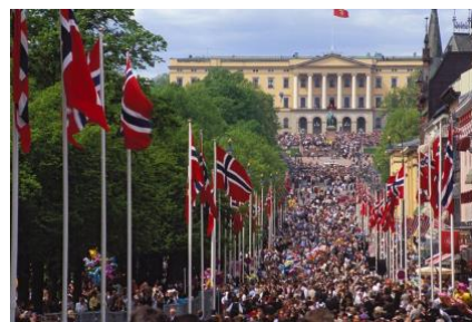
Strøget Karl Johann med kongeslottet